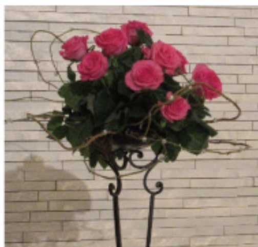
▲小根森会長作「ガバナーをお迎えて」