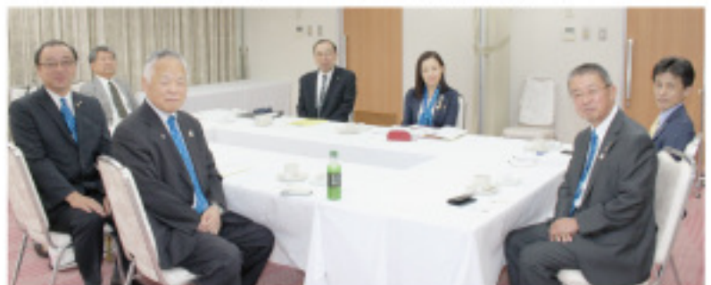
▼例会、フォーラムに先立ち懇談会が開催されました

最近大胆な変革を試みているロータリーの規定審 議会をふと思ひ出しました。うちのクリニックのお盆休み については1年間猶予がありますので、じっくり考えよう と思います。ロータリーの4つのテストも参考に致します。