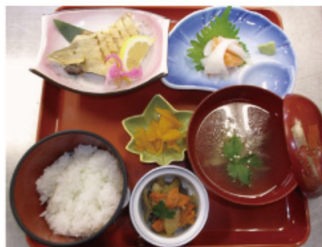
▲当時のメニューを再現

当時、30歳だった私も、60歳になりました。長い間、ありがとうございました。それでは懐かしい映像を見てください。