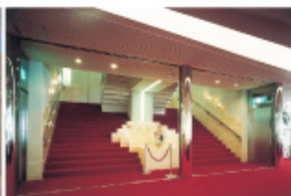
▲ロビー、階段は真っ赤な絨毯