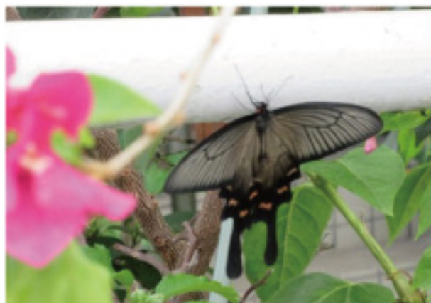
▲クロアゲハが成虫になったばかりでしょうか。