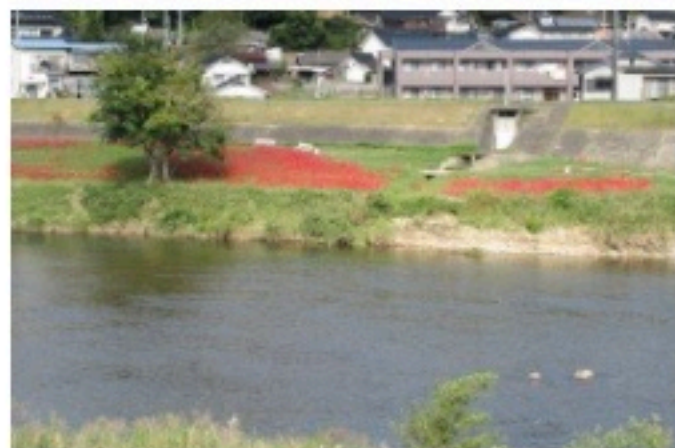
▲旭橋上流三次町側からのながめ、もののけミュージアムからも近い。

2020年10月6日、朝のNHKニュースで、寺戸の西城川左岸に植えられている曼珠沙華が満開と紹介されていました。天気も良いので、昼休みの散歩をしながら見てきました。