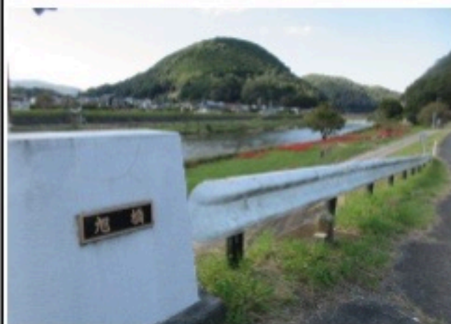
▲旭橋から比叡山が見えてきました。曼珠沙華も河川敷に見えてきました。