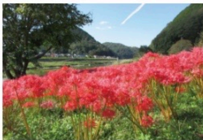
▲見事に凛として咲き誇っている曼珠沙華。