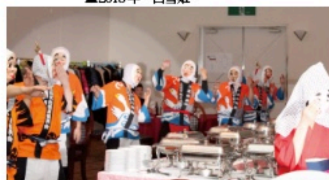
▲2015年 ひょっとこ踊り