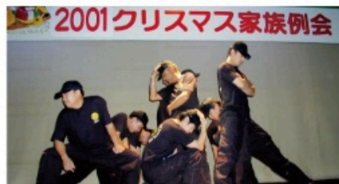
▲2001年 クールブラックス