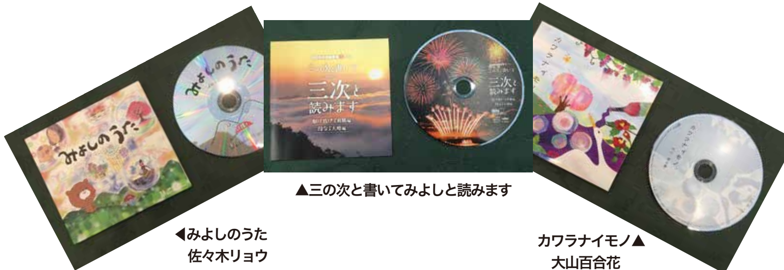
▲三次と書いてみよしと読みます