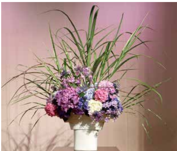
■小根森会員作「門出」