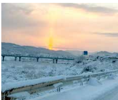
▼日の出と雪景色のコラボ／山崎会員