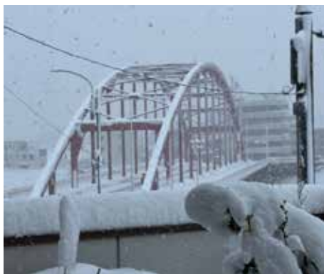
▲巴橋雪景／安藤会員