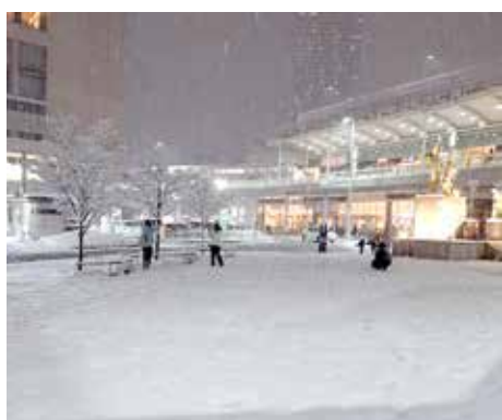
▼8日夜広島駅前／中島会員