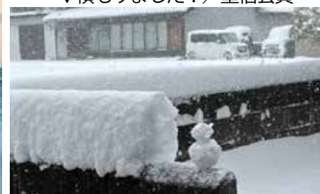
▼積もりました！／重信会員